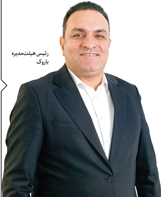
رئیس هیئت‌مدیره باروک

صنعت در یکپارچگی با بازارها و توسعه ابزارهایی مانند فاکتورینگ معکوس رقم خواهد خورد. او همچنین بر نقش سواد مالی و جایگزینی ابزارهای سنتی مانند چک با دارایی‌های دیجیتال برای افزایش تاب‌آوری اقتصادی تأکید دارد. از نگاه مظاهری، لندتک می‌تواند با تمرکز بر تأمین مالی B2B و همکاری با بازار سرمایه، نقدینگی را به صورت هدفمند و مولد در اقتصاد توزیع کند.