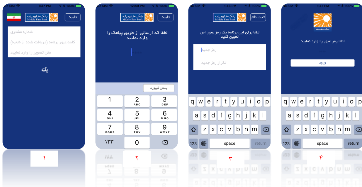
تصویر ۱. مراحل ثبت نام در پلتفرم iOS

۳. حال با وارد نمودن رمزی که در بند قبل تعریف شده است می‌توان وارد برنامه شد.